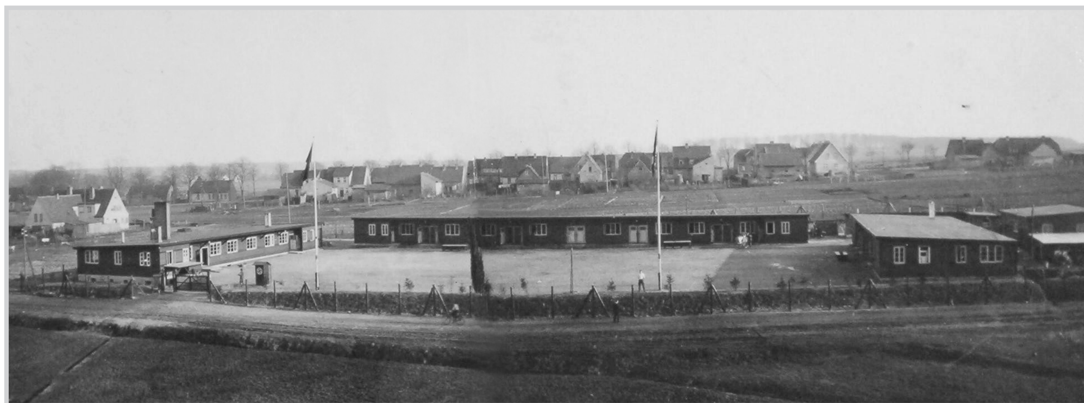
Das „Hermann-Löns-Lager“ am Alten Postweg in Walsrode wurde 1934 als Lager des Reichsarbeitsdienstes (RAD) eingerichtet. Während des Krieges diente es als Unterkunft für sog. „Fremdarbeiter“.

Von 1939-1945 wurden in Deutschland insgesamt ca. 9,5-10 Millionen Menschen als Zwangsarbeiter eingesetzt, davon war ein Drittel weiblich.