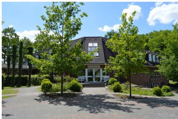
Unser Quartier in Oese