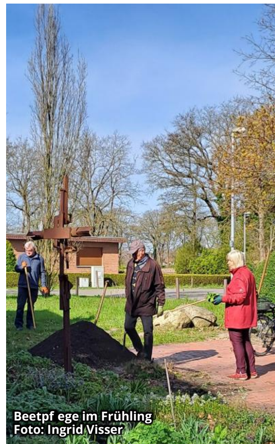
Beetpflege im Frühling

Gemeindehaus Petruskirche Verbindungsweg 33 Kaffee/Buchvorstellung mit Sigrid Tinz Samstag, 19. Sept., 15.00 Uhr