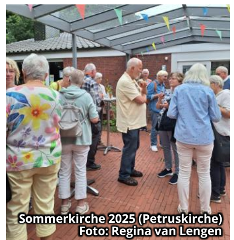
Sommerkirche 2025 (Petruskirche)

Wer mag, bleibt danach noch ein bisschen. Zum Reden, Lachen, Durchatmen mit Wein und Knabereien. So darf Sommer sein!