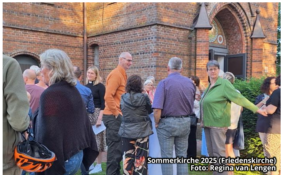
Sommerkirche 2025 (Friedenskirche)

Wir starten mit einer kleinen Ausnahme: Am 5. Juli sind wir um 10 Uhr zu Gast in der Reformierten Kirche Loga. Danach wird es dann abendlich: Immer sonntags um 19 Uhr feiern wir abwechselnd in der Friedenskir-