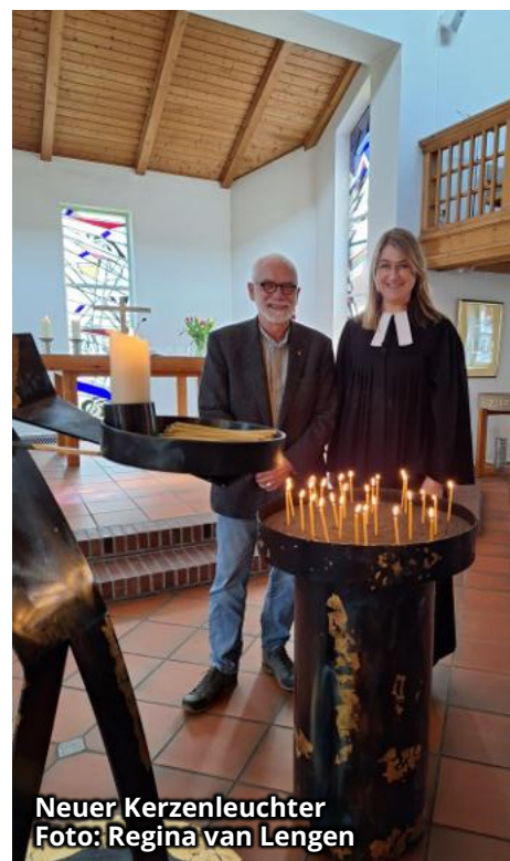
Neuer Kerzenleuchter