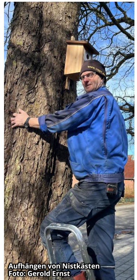
Aufhängen von Nistkästen

zusammen, bildet eine Gemeinschaft, erfreut sich am gemeinsamen Tun, gemeinsamen Gesprächen und Erlebnissen. Aber ehrenamtliche Tätigkeit ist nicht immer nur Vergnügen. Diejenigen, die Aufgaben übernehmen, übernehmen auch Verantwortung. Dafür, dass sie erledigt werden, dass Aktivitäten geplant und organisiert werden, dass Termine eingehalten werden, dass ein gutes Miteinander ermöglicht wird. Verantwortungsbewusstsein geht einher mit Teamfähigkeit, Verlässlichkeit und manchmal auch mit Geduld und einer gewissen Frustrationstoleranz. Danke, liebe Ehrenamtliche, für das alles!