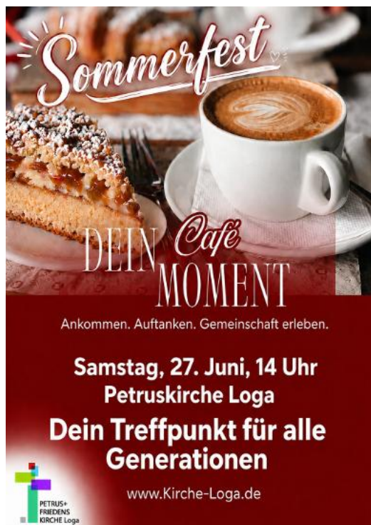
Café „Dein Moment“