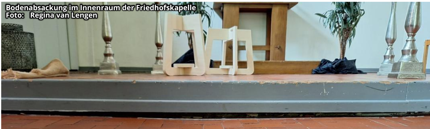
Bodenabsackung im Innenraum der Friedhofskapelle

ist und den Friedhof Loga mit insgesamt 40.000 Euro für die geplanten Maßnahmen unterstützt. Dafür sagen wir herzlich „Danke“! Nun werden weitere Angebote eingeholt und eine konkrete Bauzeitenplanung wird erstellt. Und dann kann es hof endlich bald losgehen.