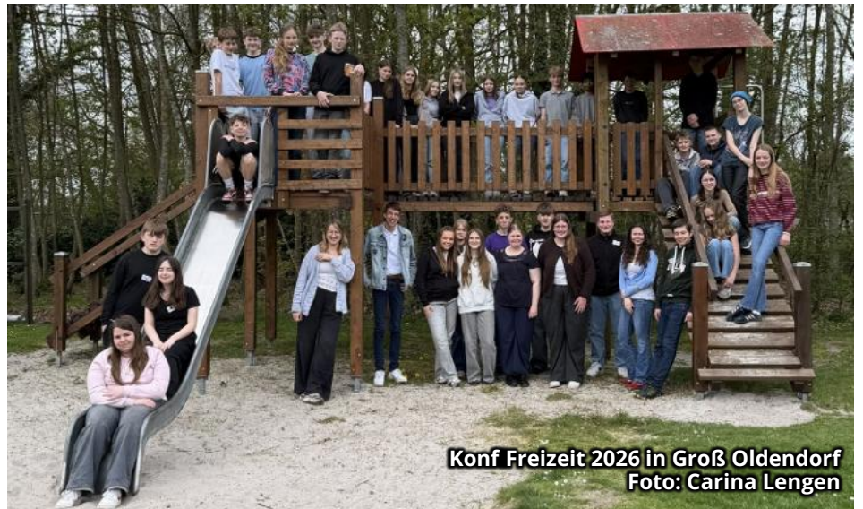
Konf Freizeit 2026 in Groß Oldendorf

(Ijā) Ein Jahr Konf-Zeit liegt hinter ihnen: mit Fragen, Aktionen, Gottesdiensten, zwei gemeinsamen Freizeiten und erstaunlich viel guter Laune. Am 2., 3. und 10. Mai wurden 30 Jugendliche in unserer Kirchengemeinde konfirmiert. Wir sagen: Schön war's mit euch! Und von Herzen: Gottes Segen für euren Weg!