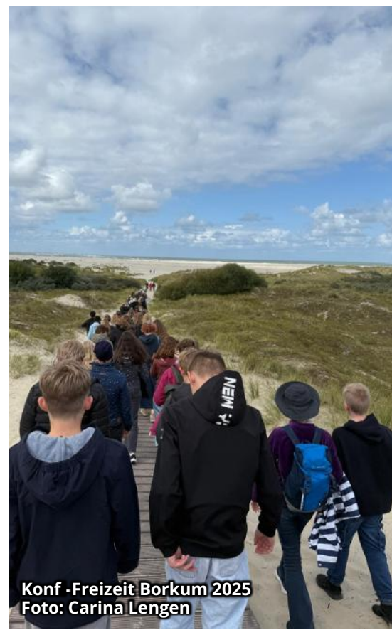
Konf -Freizeit Borkum 2025

Die Gitarrenjugend Loga besteht im kommenden Jahr bereits 20 Jahre! Das möchten wir gerne vor den Sommerferien 2027 feiern. Darauf freuen wir uns schon.