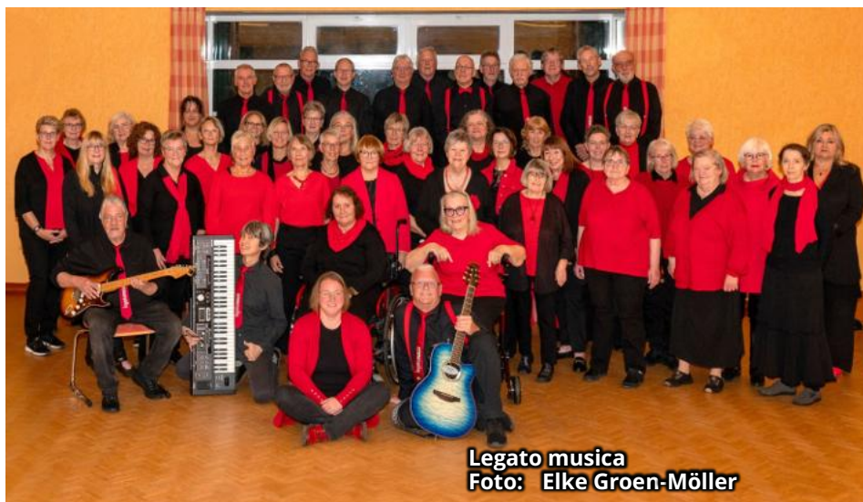
Legato musica

Friedenskirche Loga Samstag, 6. Juni, 17.00 Uhr