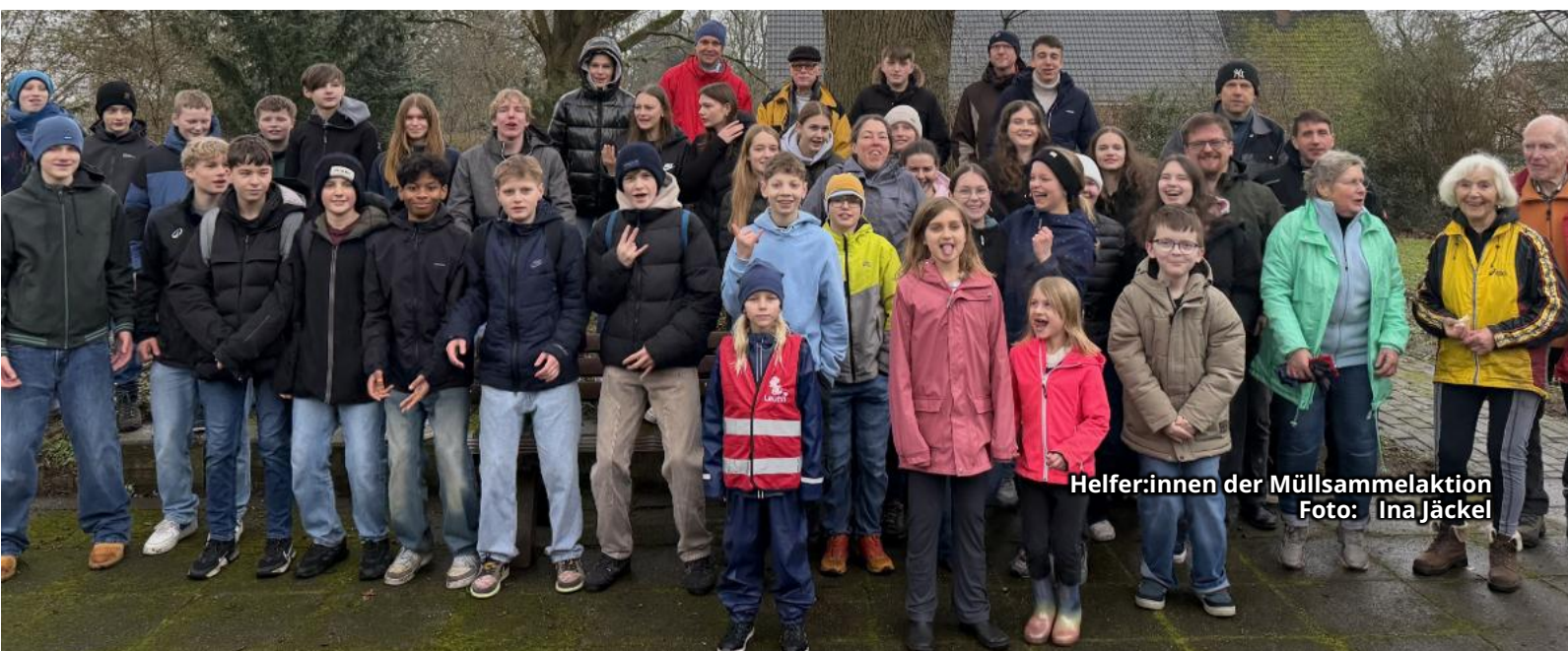
Helfer:innen der Müllsammelaktion

Ein herzliches Dankeschön an alle, die geholfen haben!