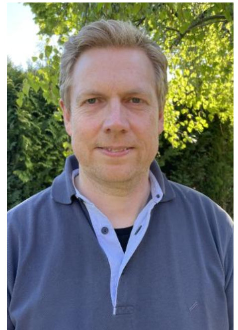
Wilfried Jansen Foto: Privat

Für die über 150 Standorte mit Altglascontainern im Landkreis gibt es einen Mitarbeiter, der herumfährt und saubermacht - es entstehen dadurch Zusatzkosten für die Allgemeinheit. Für die Sauberkeit bei den Altkleidercontainern ist ein Verwertungsunternehmen zuständig. Da die Preise für Altkleider im Keller sind, erschweren beigestellte und eingefüllte Störstoffe den Betrieb und damit die zukünftige Aufrechterhaltung dieser Standorte.