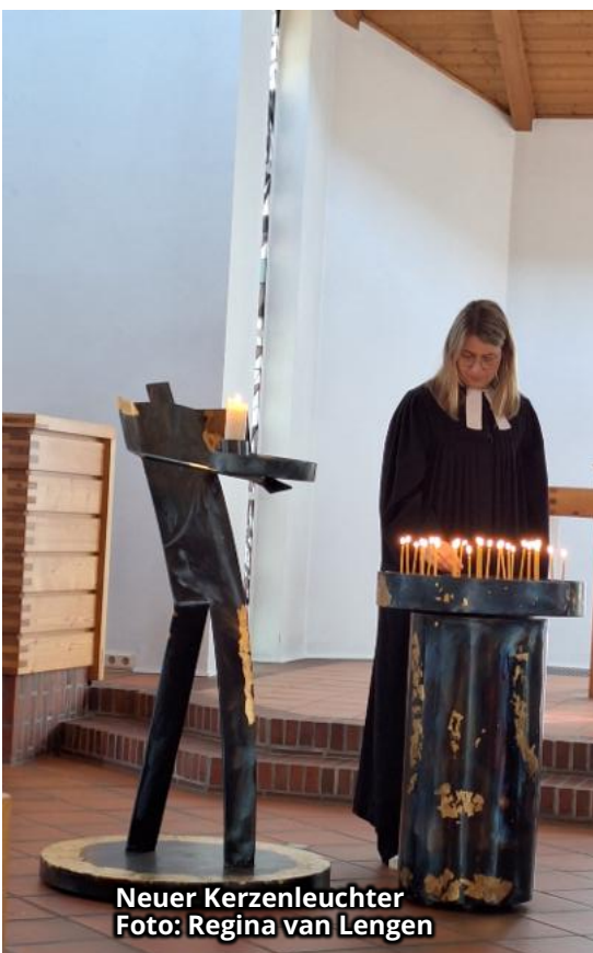
Neuer Kerzenleuchter

(Ijā) Schon lange haben wir uns für unsere Gottesdienste – besonders für die Taizé-Gottesdienste – einen Ort gewünscht, an dem Menschen Lichter für sich, ihre Lieben und ihre Anliegen anzünden können. Eine Idee entstand, Spenden wurden gesammelt, und der Künstler Peter Kärst setzte unsere Gedanken in seinem Werk um. Nun ist unser neuer Kerzenleuchter fertig: mit drehbarer Kerzenschale, schwarzem Sand und goldenen Kerzen. Jetzt leuchten dort unsere Gebete, Hoffnungen und Gedanken. Wir freuen uns sehr über dieses besondere Kunstwerk.