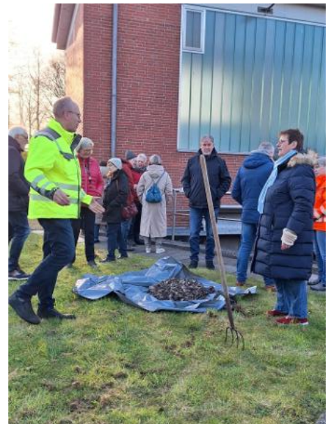
Passionspunkt Pumpwerk